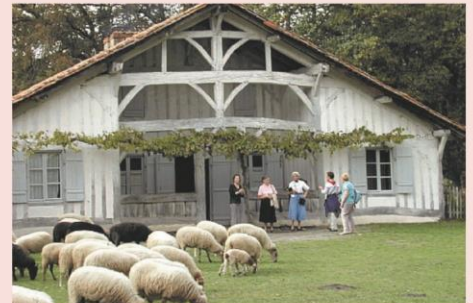
Ecomusée de Marquèze