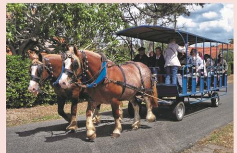
Balade en attelage