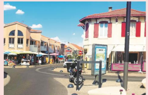
Centre ville de Mimizan Plage

Le programme d'activités est donné à titre indicatif et est susceptible d'être aménagé selon les conditions météorologiques ou la disponibilité du prestataire. Le programme détaillé sera transmis aux organisateurs au plus tard 7 jours avant le début du séjour. Piscine chauffée à disposition sur le centre et plage à 400 mètres, n'oubliez pas votre tenue de bain !